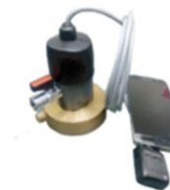
ハイドロフォンアダプター 音聴センサー