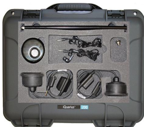
パッケージデバイス