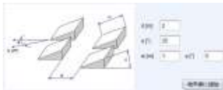
▼架台パネルの影計算

Map位置情報と周辺遮蔽物の設定によってパネルラック影、建物影を計算します。パネルラックの傾きと行間隔を変えながら最大の発電量の条件が得られます。また複数の建物影や電柱影などを反映させたシミュレーションが出来ます。