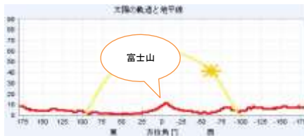
▼太陽軌道と水平線